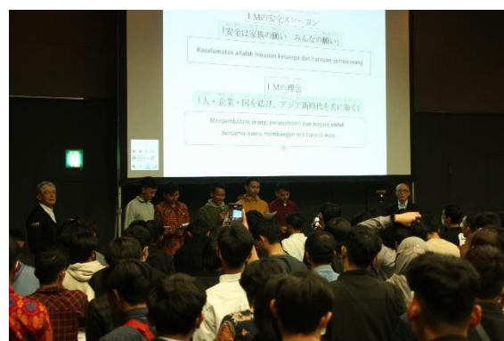
▲「安全は家族の願い みんなの願い」 インドネシア語で安全衛生スローガンを復唱しました