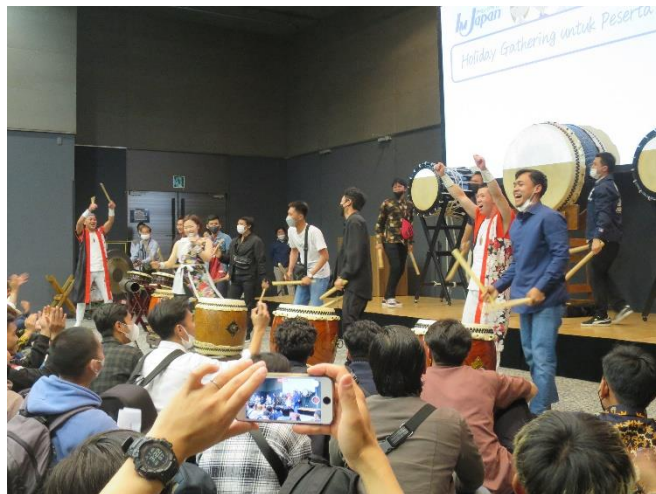
▲和太鼓体験会で盛り上がるインドネシア人技能実習生

最後は和太鼓の生演奏や和太鼓体験会など日本の文化に触れられるレクリエーションをはじめ抽選会などが行われました。