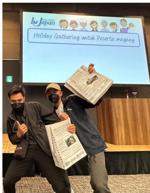
▲当選し、ポーズを決めるインドネシア人技能実習生