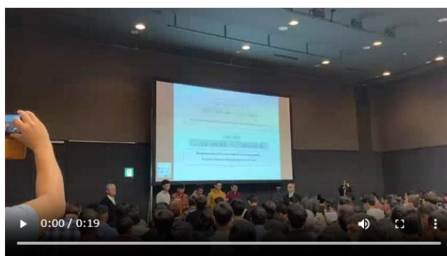
▲安全衛生スローガンを復唱する様子