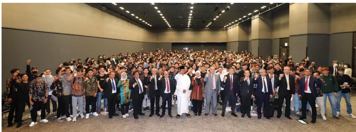
▲記念撮影をする会場参加者

全国のAIM・ジャパン技能実習生は本日も安全に気をつけながら元気いっぱい実習に取り組んで参ります。本日もご安全に！