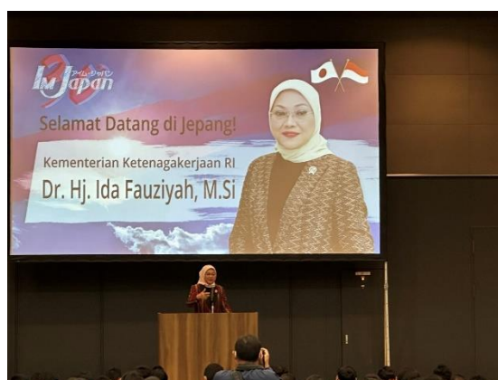
▲インドネシア人技能実習生を激励するイダ大臣