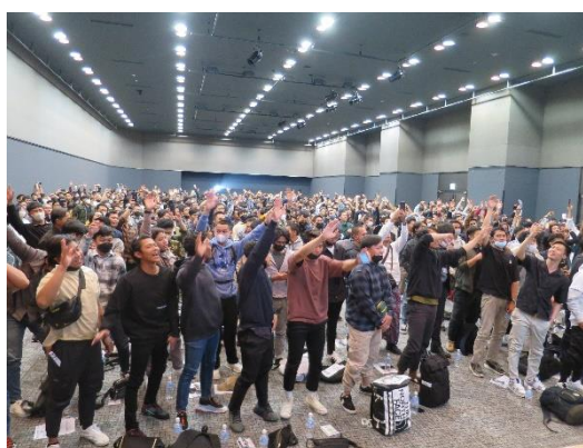
▲ギターに合わせて大合唱するインドネシア人技能実習生