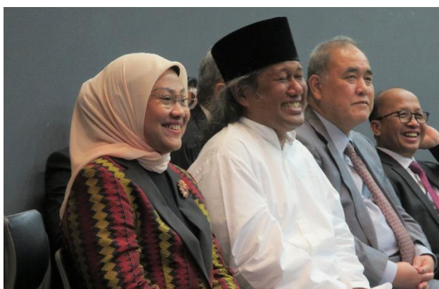
▲イダ・ファウジヤ労働大臣をはじめとした来賓の方々 (当機構の金森会長は右から 2 番目)

2023年5月3日(水)、インドネシアのイダ・ファウジヤ労働大臣の来日に合わせて、ベルサール秋葉原にて「インドネシア技能実習生休日の集い」(以下:集い)を開催しました。会場には当機構のインドネシア人技能実習生 900 名以上が集合し、インドネシア労働省やインドネシア大使館、アイム・ジャパン関係者などを含め、およそ 1000 名が集まりました。