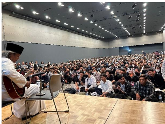
▲ギター演奏と歌に聞き入るインドネシア人技能実習生