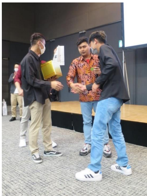
▲抽選会でくじをひくインドネシア人技能実習生