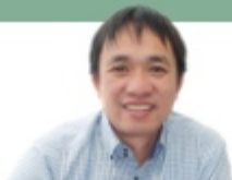
長野支局 ハイ職員