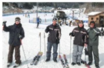
実習が休みの日には、連れ立って出かけることも。冬はスキーにも挑戦！