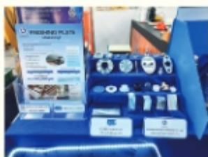
工場で手がけている精密加工部品の数々。日本の自動車やバイク、農業機械などに使われています

日本で頑張っている後輩たちへ 実習や日本語の勉強に一生懸命に取り 組んでください。日本語はN1、N2の合 格を目指してください。そうすればタイ に戻った時に、きっとより明るい未来が 待っています。私が保証します。