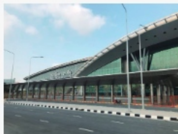
クルンテープ・アピワット中央ターミナル駅 (旧称：パンスー中央駅、ジェット口撮影)

おいて、ピエンチャン～バンコク路線は7月末から8月上旬に開通する予定との発言があった。