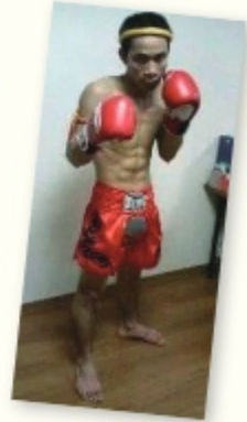
子どもの頃からムエタイ（格闘技の一種）を続けています