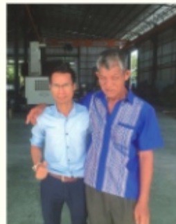
2020年に新工場を建てた際、お祝いにつけてくれた父親と