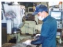
実習生も一緒にものづくりをする仲間。ミーティングにも参加します