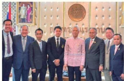
ピパット氏がタイ王国の労働大臣に就任された際に、技能実習修了生の代表の一人として表敬訪問。挨拶と意見交換をする機会に恵まれました

経営する会社の工場。日系企業で通訳をしていた縁で、24年からは日本を代表する自動車メーカーの部品も製造しています