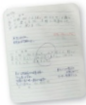
日記には必ず生活指導員がコメントします