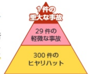
図 ハインリッヒの法則