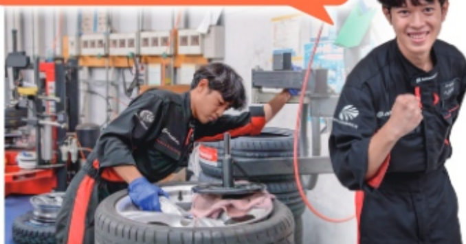
ヘンドリさん（2年目）