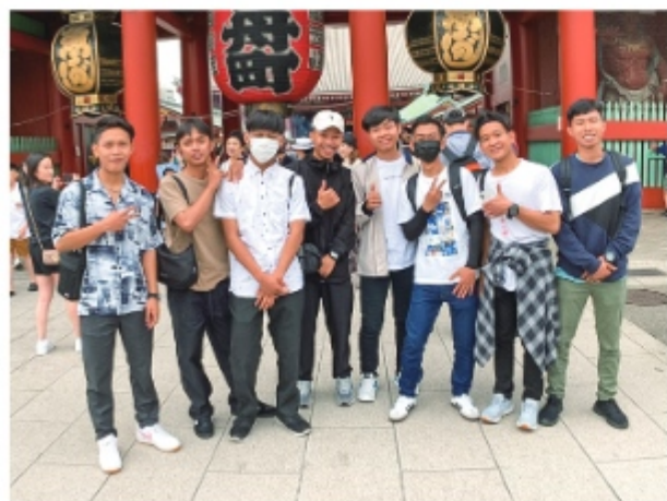
社員旅行で東京・浅草に行きました。 写真から雰囲気の良いさが伝わってきます

彼らの努力する姿勢や一生懸命さが伝わってか、お客さまからの評判は上々とのこと。店舗のアンケートには「〇〇さん頑張ってください」「〇〇さんにまたオイル交換を担当してもらいたい」など、実習生の名前入りで応援メッセージが届くことも少なくないそうです。