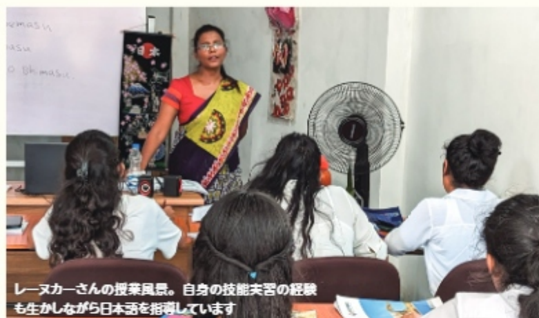
レーヌカーさんの授業風景。自身の技能実習の経験も生かしながら日本語を指導しています