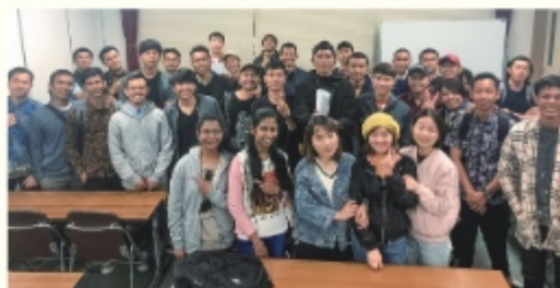
技能実習中に参加していた日本語研修会のクラスメイトと

日本語学校では、チームで活動する練習として、みんなで飾りを作ったり、ペアで作業したりします